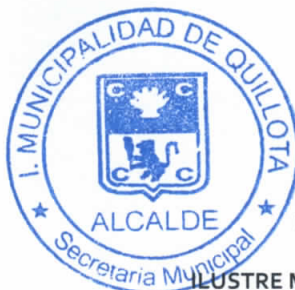
DR. LUIS MELLA GAJARDO ALCALDE ALUSTRE MUNICIPALIDAD DE QUILLOTA

DISTRIBUCION: 1.- Secretaría Municipal. 2.- Control Interno. 3.- Presupuesto. 4.- Finanzas. 5. Comunicaciones.- 6.- Interesado.- 7.- Archivo Personal